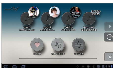
スマートフォン版 music-Chef 画面イメージ